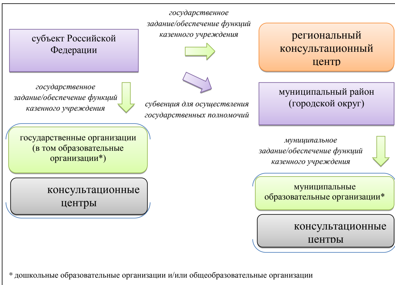
Рисунок 2 - Организационно-финансовая схема функционирования консультационного центра на уровне субъекта Российской Федерации

Органы государственной власти субъекта Российской Федерации: