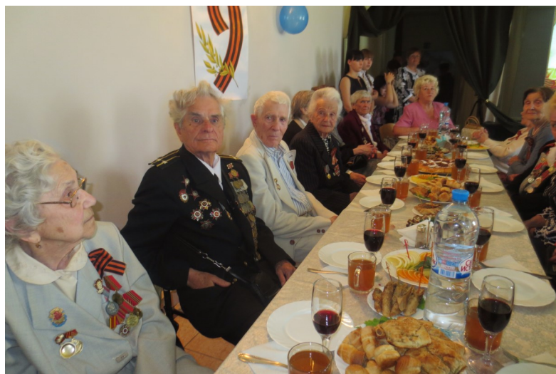
Члены клуба «Оптимист» за праздничным столом