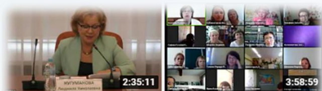
«Digital как новая философия...»

Проекты по проблемам цифровой трансформации образовательного пространства ДПО: «Учительский портал», «Виртуальная стажировка», выпуск журнала «Актуальная педагогика»